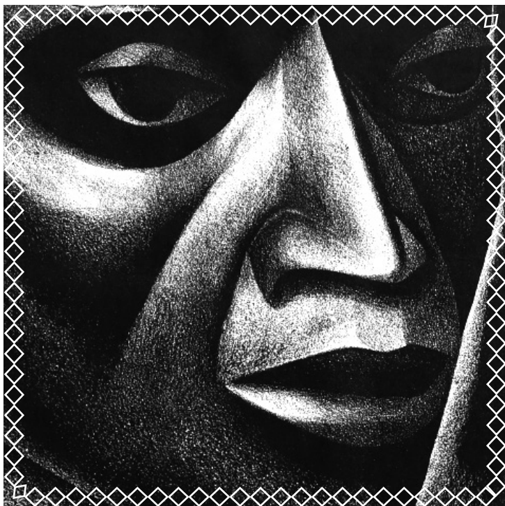
ELIZABETH CATLETT — Negro es Bello (détail)