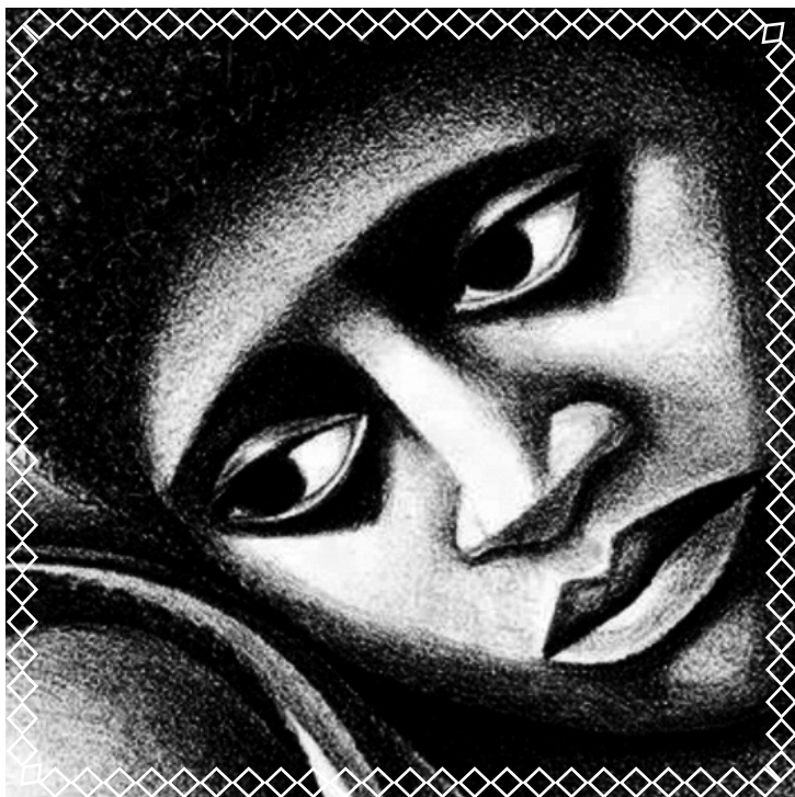
ELIZABETH CATLETT — Madonna (détail)