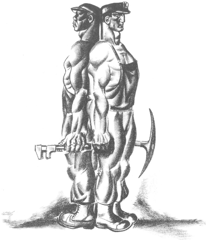
HUGÓ GELLÉRT — The Working Day