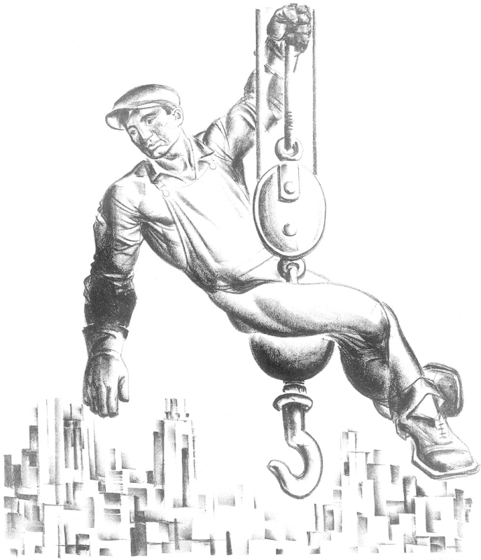
HUGÓ GELLÉRT — Useless