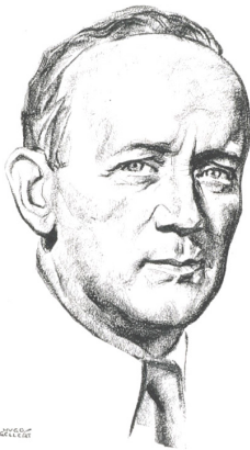
HUGÓ GELLÉRT — William Z. Foster